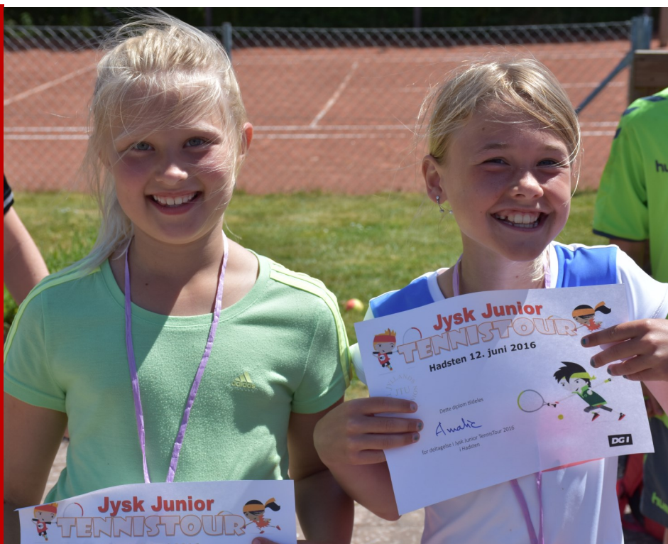
Glade juniorspillere til Jysk Tennis Tour 2016

Læs mere om HEAD Tennis-skole på DTF hjemmeside www.tennis.dk